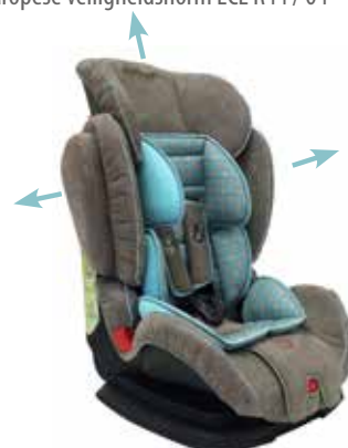
3 réglages du dossier - 3 rug posities

Jusqu'à épuisement des stocks / Zolang de voorraad strekt