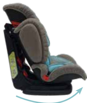
Position inclinée - Gekantelde positie