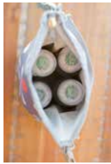
ref AC016 : Sac isotherm / Isotherm zak