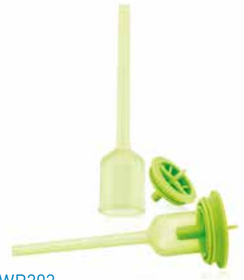
ref. WR203 : kit de remplacement vervang kit