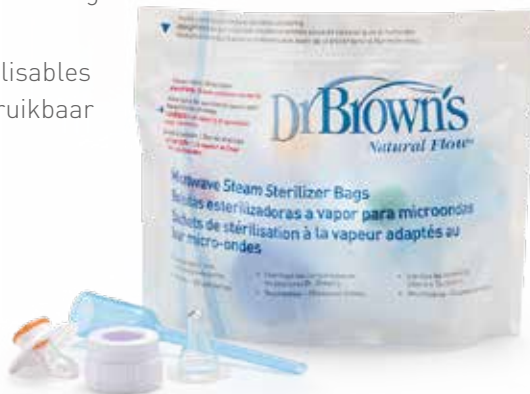
ref 960 : (5 pc) réutilisables (5 st) herbruikbaar