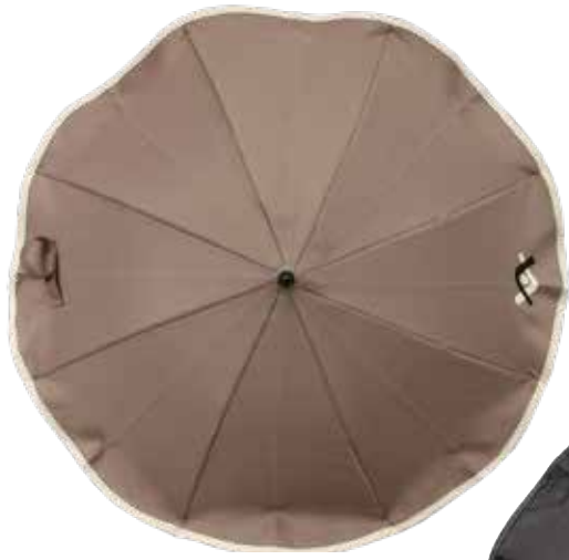
OMB - Ombrelle / Parasol Noir / zwart - Taupe - Gris clair / Lichtgrijs