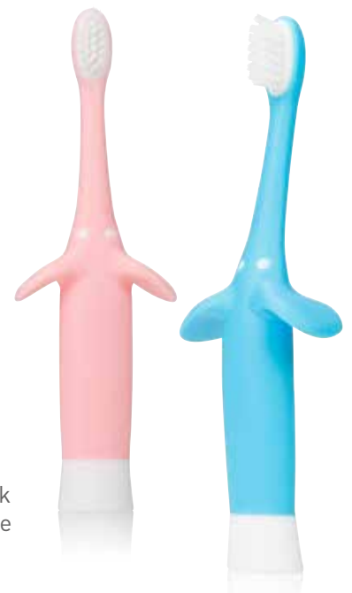
ref. HG013 : pink ref. HG014 : blue

De olifant vorm maakt het moment tanden-poetsen tot een plezier!