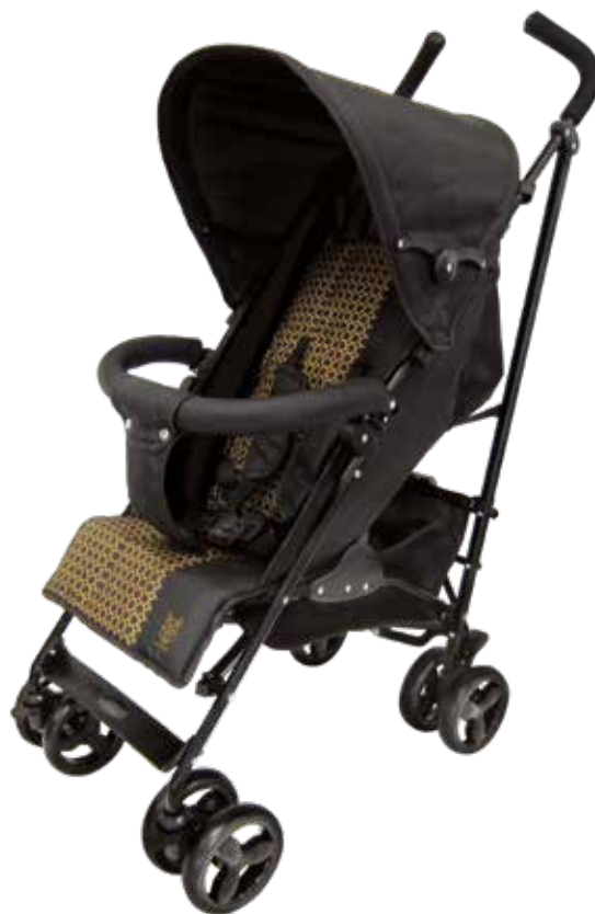
Ref. : CHAB-1006 Smart

Compatible uniquement sur les véhicules équipés d'origine d'un système de fixation ISOFIX Alleen compatibel bij auto's die oorspronkelijk uitgerust zijn met een ISOFIX systeem