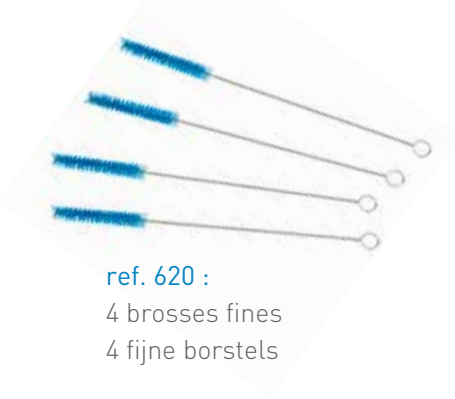
ref. 620 : 4 brosses fines 4 fijne borstels