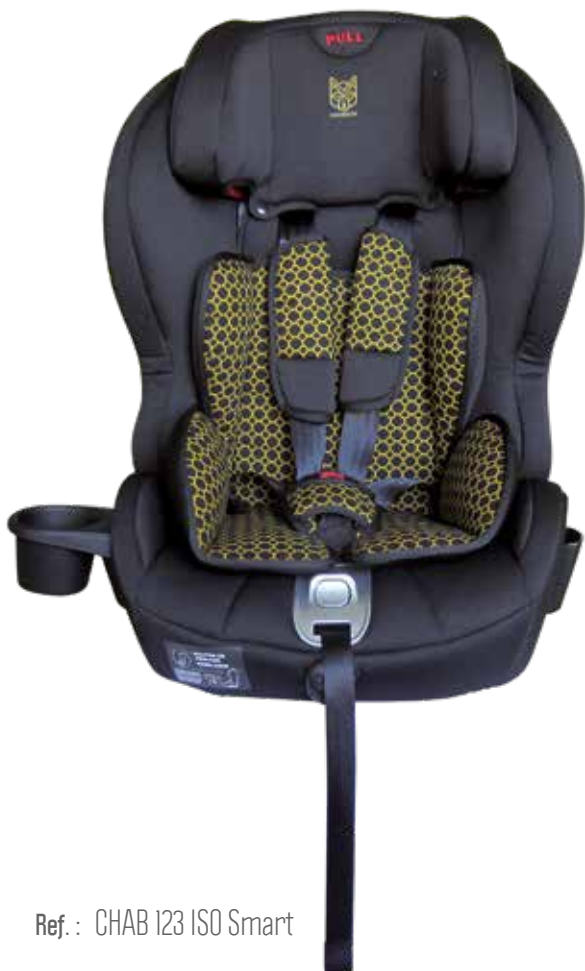
Ref. : CHAB 123 ISO Smart