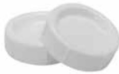
ref. 680 : 2 disques de voyage 2 reisdoopjes