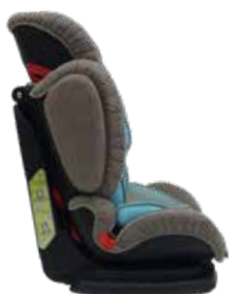
Position initiale - Initiële positie